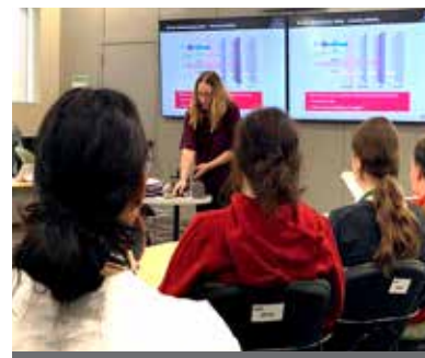
Foto: Alunos assistem a uma demonstração nas nossas instalações em Peterborough.

Recebemos mais de 50 alunos indígenas do nono ano nas nossas instalações de Peterborough para uma apresentação sobre a ciência e os benefícios da energia nuclear, além de uma visita às nossas instalações de fabrico de combustível.